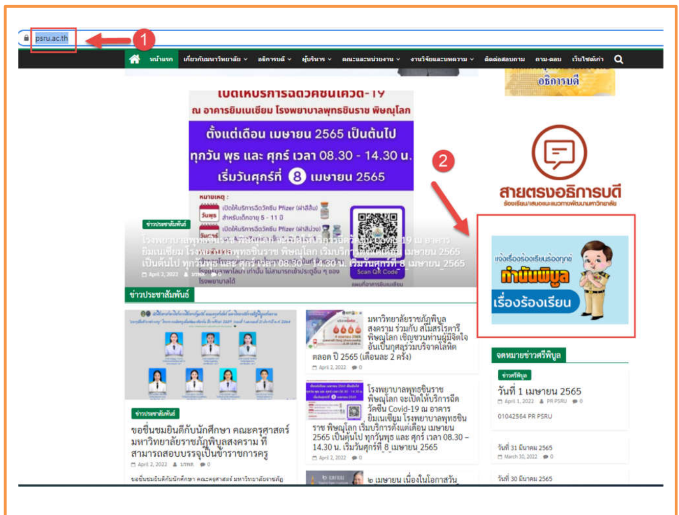
ภาพที่ 1 แสดงช่องทางออนไลน์การเข้าถึงเรื่องร้องเรียนต่าง ๆ

การเข้าถึงข้อมูลบนเว็บไซต์ มหาวิทยาลัยราชภัฏพิบูลสงคราม หน่วยงานที่รับผิดชอบได้ มีการแสดงข้อมูลสถิติเรื่องร้องเรียนการทุจริตและประพฤติมิชอบของเจ้าหน้าที่ของหน่วยงาน โดยได้มีการรายงานผลการดำเนินการจัดการเรื่องร้องเรียนต่ออธิการบดีและเผยแพร่ให้ผู้มีส่วนได้ส่วนเสียรับรู้รับทราบผลการดำเนินงาน โดยสามารถเข้าได้ที่เว็บไซต์หลักของมหาวิทยาลัยฯ https://www.psu.ac.th/ เมนู กำนันพิบูล https://imis.psu.ac.th/appeal/appeal_add.php และเมนูรายงานผลการร้องเรียน http://1.179.213.178/~hr/wp-content/uploads/2023/04/O29.pdf ดังรูป