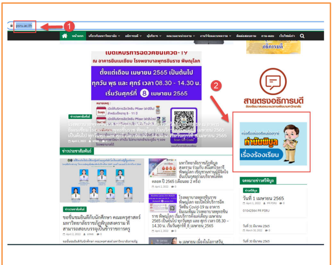
ภาพที่ 1 แสดงช่องทางออนไลน์การเข้าถึงเรื่องร้องเรียนต่าง ๆ

การเข้าถึงข้อมูลบนเว็บไซต์ มหาวิทยาลัยราชภัฏพิบูลสงคราม มีการแสดงช่องทางที่บุคคลภายนอกสามารถแจ้งเรื่องร้องเรียนเกี่ยวกับการทุจริตมิชอบของเจ้าหน้าที่ของหน่วยงานผ่านทางออนไลน์ โดยแยกออกจากช่องทางทั่วไป เพื่อเป็นการคุ้มครองข้อมูลผู้แจ้งเบาะแสและเพื่อให้สอดคล้องกับแนวทางการปฏิบัติการจัดการเรื่องร้องเรียนการทุจริตและประพฤติมิชอบ โดยสามารถเข้าได้ที่เว็บไซต์หลักของมหาวิทยาลัย https://www.psu.ac.th/ เมนู กำนันพิบูล https://imis.psu.ac.th/appeal/appeal_add.php ดังรูป