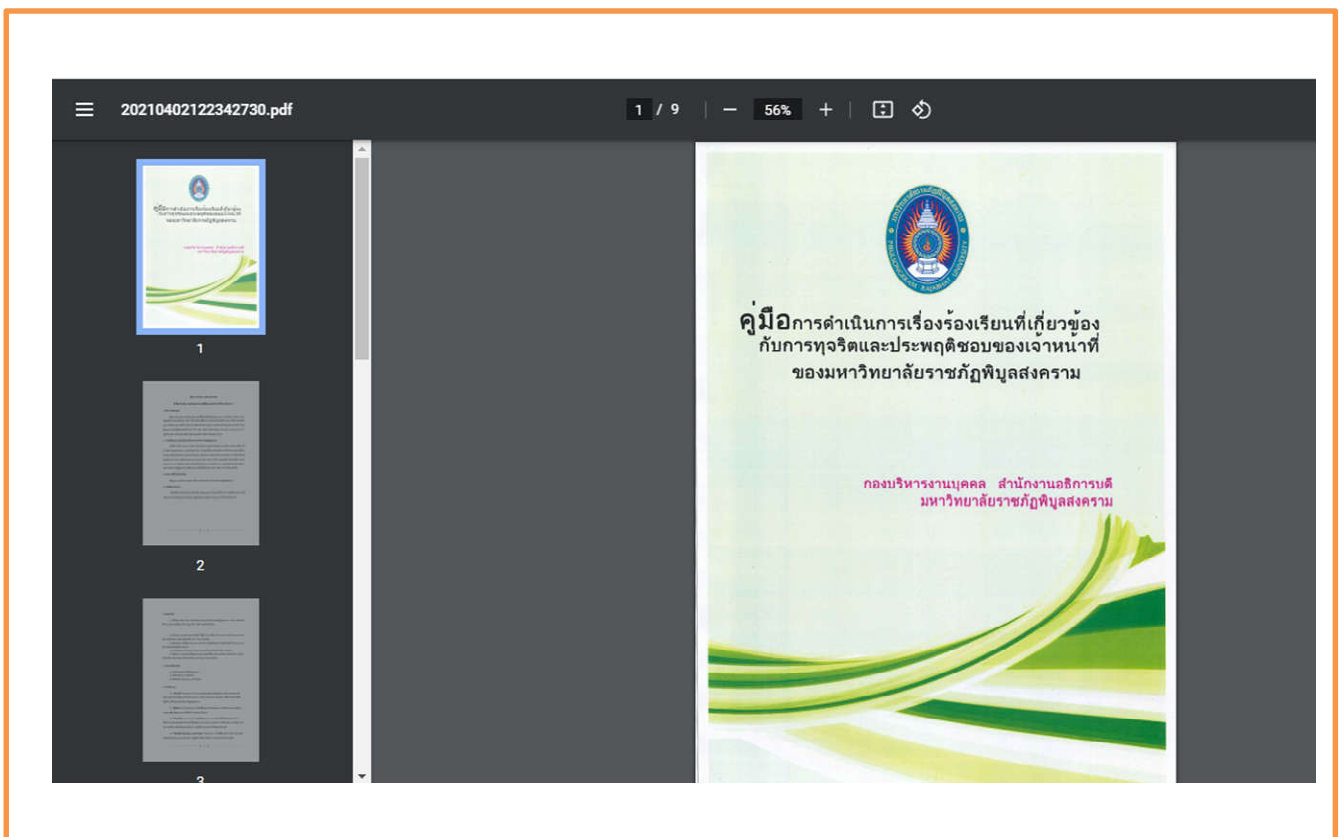
ภาพที่ 4 แสดงคู่มือการดำเนินการเรื่องร้องเรียนฯ http://personnel.psu.ac.th/man_manage/O29.pdf