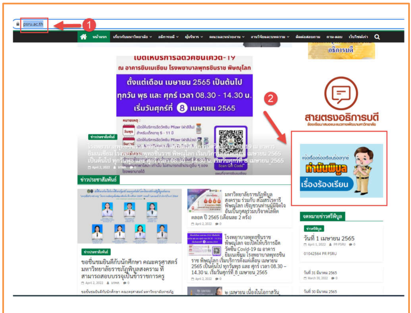
ภาพที่ 1 แสดงช่องทางออนไลน์การเข้าถึงเรื่องร้องเรียนต่าง ๆ “กำนันพิบูล”

การเข้าถึงข้อมูลบนเว็บไซต์ มหาวิทยาลัยราชภัฏพิบูลสงคราม มีการแสดงคู่มือหรือแนวทางการดำเนินงานต่อเรื่องร้องเรียนที่เกี่ยวข้องกับการทุจริตและประพฤติมิชอบของเจ้าหน้าที่ของหน่วยงาน เช่น รายละเอียดวิธีการที่บุคคลภายนอกจะทำการร้องเรียน รายละเอียดขั้นตอนหรือวิธีการในการจัดการต่อเรื่องร้องเรียน ส่วนงานที่รับผิดชอบ ระยะเวลาดำเนินการ เป็นต้น โดยสามารถเข้าได้ที่เว็บไซต์หลักของมหาวิทยาลัย https://www.psu.ac.th/ เมนู กำนันพิบูล https://imis.psu.ac.th/appeal/appeal_add.php ดังรูป