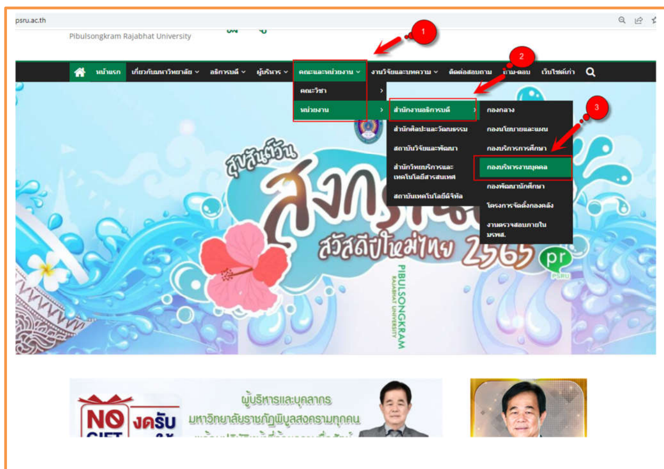
ภาพที่ 1 แสดงช่องการเข้าถึงกองบริหารงานบุคคล