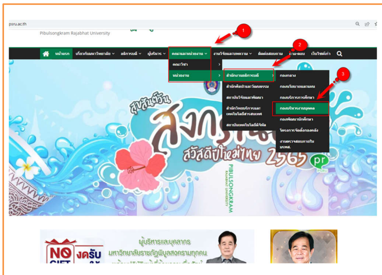
ภาพที่ 1 แสดงช่องการเข้าถึงกองบริหารงานบุคคล

การเข้าถึงข้อมูลบนเว็บไซต์ มหาวิทยาลัยราชภัฏพิบูลสงคราม มีการแสดงหลักเกณฑ์การบริหารทรัพยากรบุคคลที่ยังใช้บังคับในหน่วยงานในปี 2566 เช่น การสรรหาและคัดเลือกบุคลากร การบรรจุและแต่งตั้งบุคลากร การพัฒนาบุคลากร การประเมินผลการปฏิบัติงานบุคลากร การให้คุณให้โทษและการสร้างขวัญกำลังใจ เป็นต้น โดยสามารถเข้าได้ที่เมนู https://www.psu.ac.th/ เมนู สำนักงานอธิการบดี และเมนูย่อย กองบริหารงานบุคคล http://hr.psu.ac.th/ แสดงข้อมูลช่องทางการเข้าถึงหลักเกณฑ์การบริหารและพัฒนาทรัพยากรบุคคล http://1.179.213.178/~hr/wp-content/uploads/2023/04/o25.pdf ดังรูปภาพ