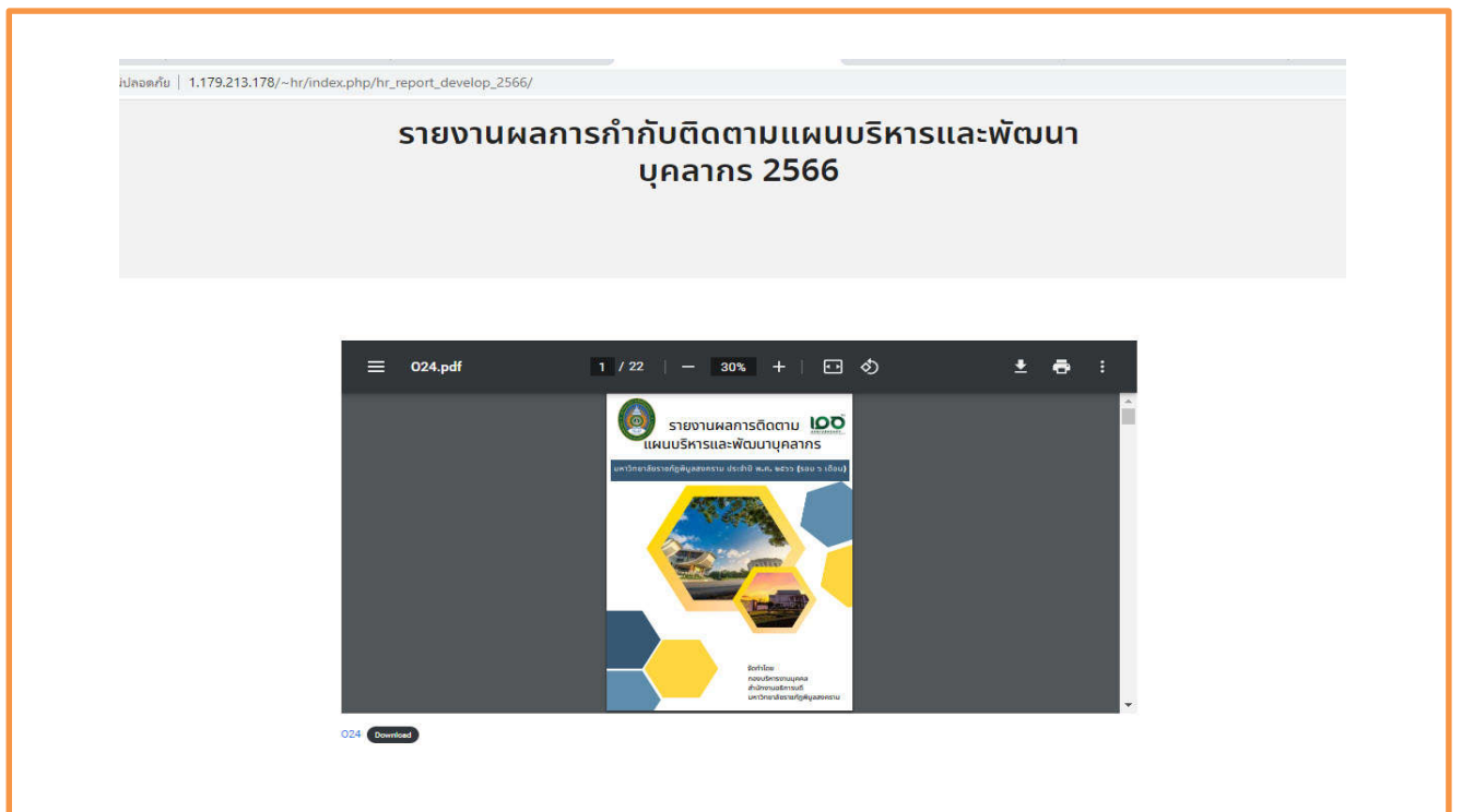
ภาพที่ 3 แสดงข้อมูลโครงสร้างหน่วยงานมหาวิทยาลัยราชภัฏพิบูลสงคราม http://1.179.213.178/~hr/index.php/hr_report_develop_2566/