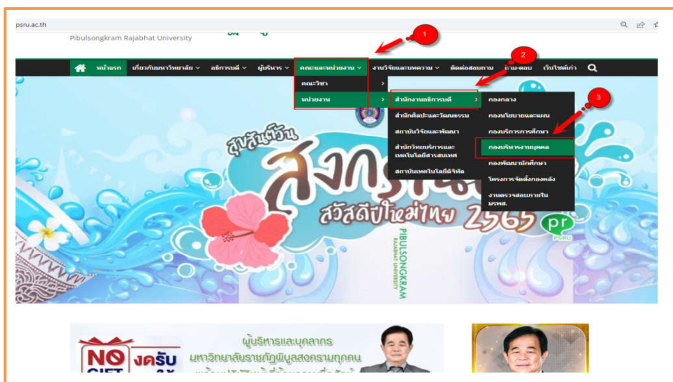
ภาพที่ 1 แสดงช่องการเข้าถึงการกองบริหารงานบุคคล

การเข้าถึงข้อมูลบนเว็บไซต์ มหาวิทยาลัยราชภัฏพิบูลสงคราม มีการแสดงความก้าวหน้าการดำเนินงานตามนโยบายหรือแผนการบริหารและพัฒนาทรัพยากรบุคคลที่ใช้ในปีงบประมาณ พ.ศ. 2566 เช่น ความก้าวหน้าการดำเนินการแต่ละโครงการ/กิจกรรม รายละเอียดงบประมาณที่ใช้ดำเนินงานแต่ละโครงการ/กิจกรรม โดยสามารถเข้าได้ที่เมนู หน่วยงาน https://www.psu.ac.th/ เมนู สำนักงานอธิการบดี เมนูย่อย กองบริหารงานบุคคล http://hr.psu.ac.th/ และหัวข้อรายงานผลการกำกับติดตามแผนบริหารและพัฒนาทรัพยากรบุคคล http://1.179.213.178/~hr/index.php/hr_report_develop_2566/ ดังรูปภาพ