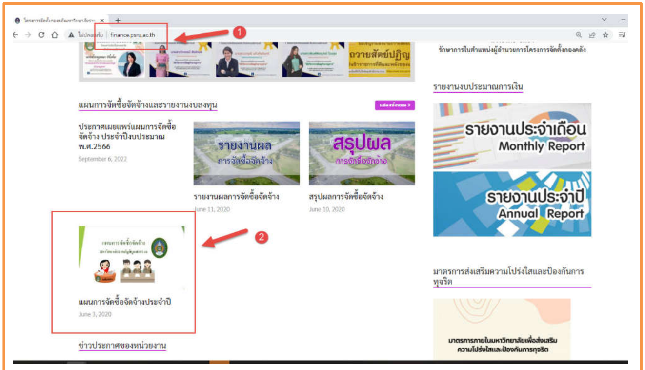
ภาพที่ 2 แผนการจัดซื้อจัดจ้างประจำปี

http://finance.psu.ac.th/index.php/2020/06/03/plan2363/